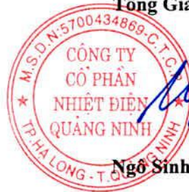
Ngô Sinh Nghĩa