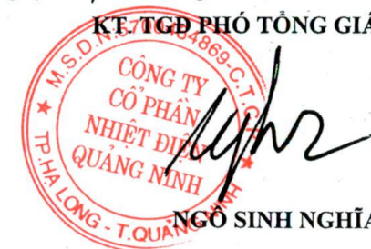
NGÔ SINH NGHĨA