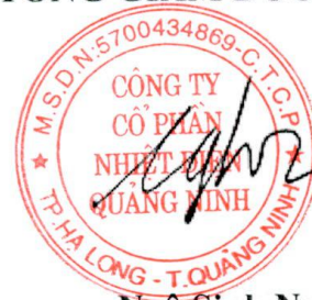
Ngô Sinh Nghĩa